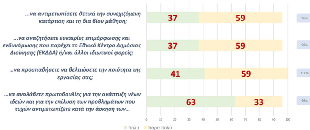
Διάγραμμα 3 - Βαθμός επίδρασης στην υιοθέτηση του ΚΗΕΣΥΔΤ (μέρος 1 από 2)